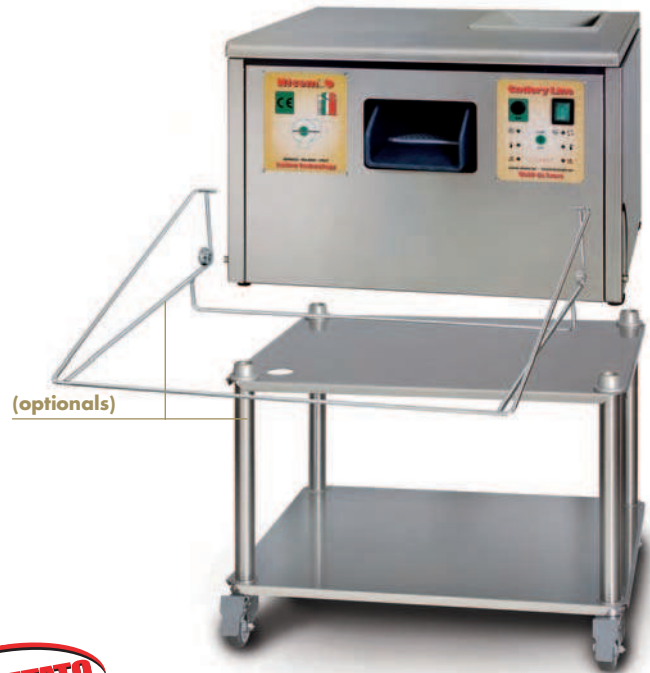
ASC 15A - BABY