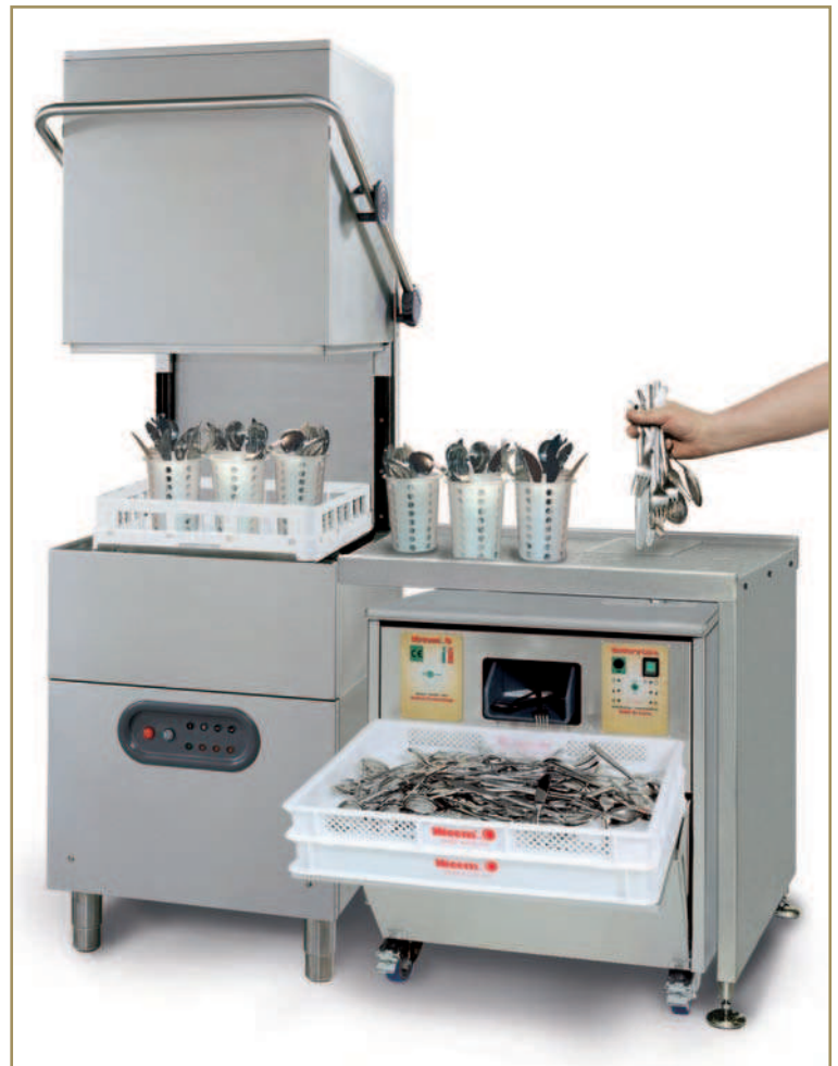
Versione integrata con lavastoviglie Built - in version with dishwasher

The models Girl and Boy can be used with all types of dishwashers by means of a worktop, whereas models Mini and Baby can be placed directly on tables, shelves or trolleys.