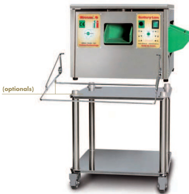
ASC 10A - MINI