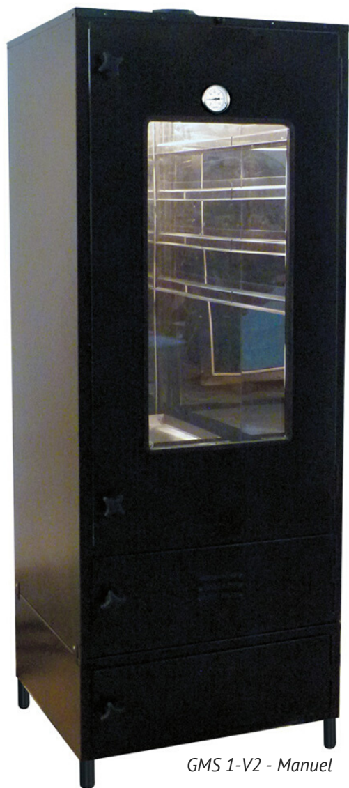
GMS 1-V2 - Manuel