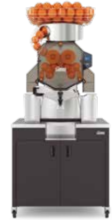
Speed Up All-in-One