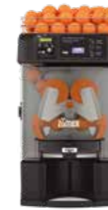
Versatile Pro Cashless